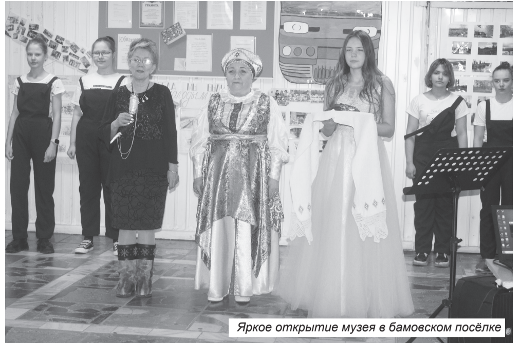
Яркое открытие музея в бамовском посёлке