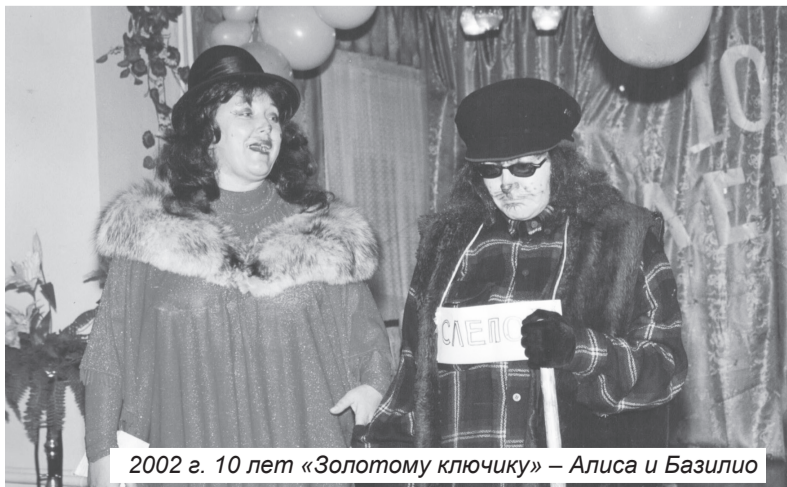
2002 г. 10 лет «Золотому ключику» – Алиса и Базилио