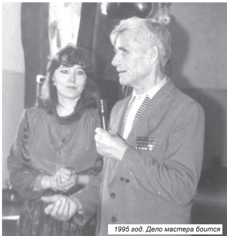
1995 год. Дело мастера боится

Анатолевны входило посещение занятий и мероприятий педагогов с «разбором полетов». Три-четыре посещения в неделю – на каждого администратора. Посещения администрации занятий объединений воспринималось адекватно, как система контроля. Наши педагоги заметно росли профессионально, это нас радовало.