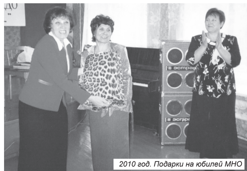
2010 год. Подарки на юбилей МНО

На заместителей директора легли и другие обязанности: создание педагогами программ нового поколения, повышение квалификации педагогов, аттестация, подготовка к профессиональным конкурсам.