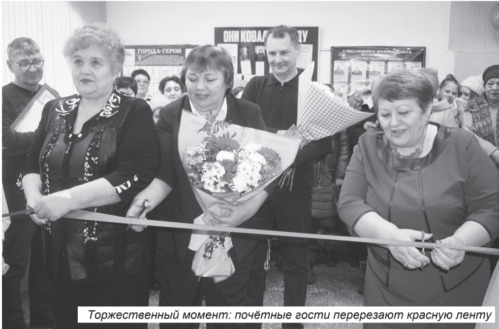
Торжественный момент: почётные гости перерезают красную ленту