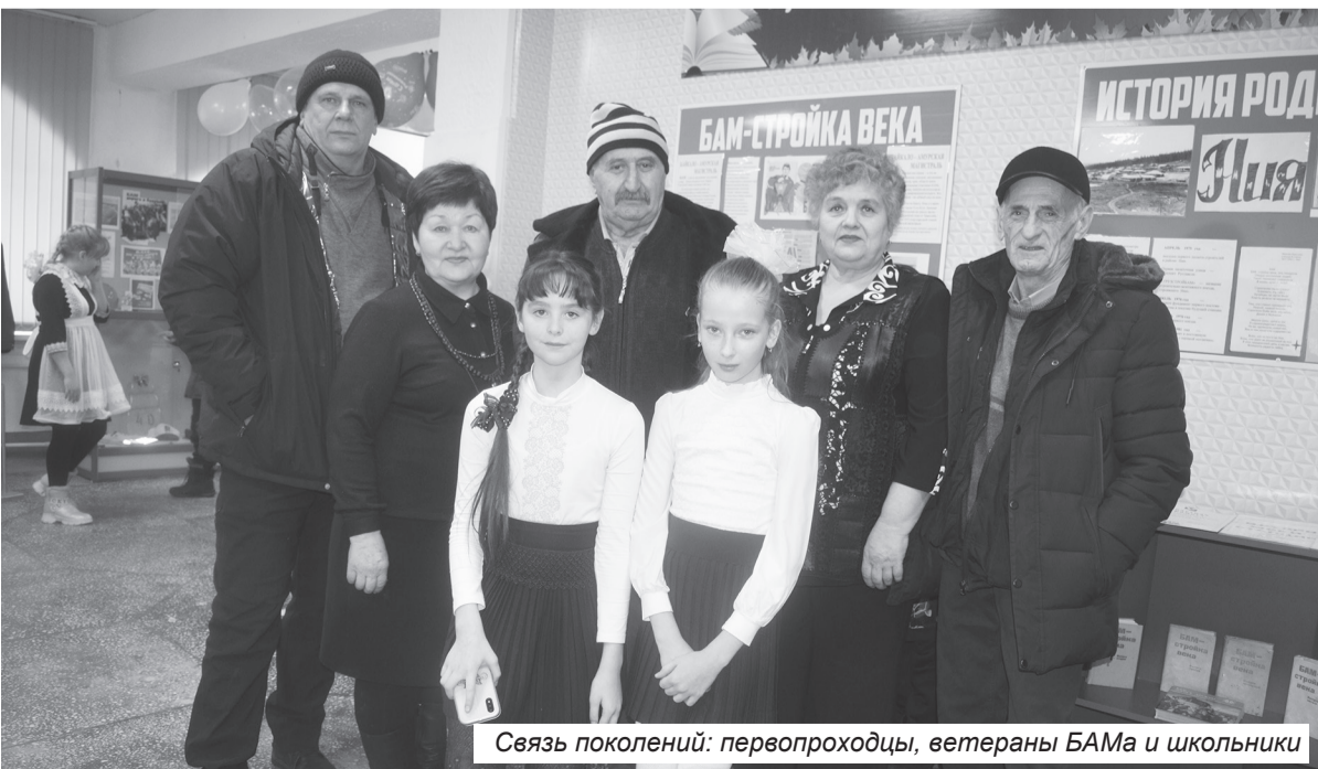
Связь поколений: первопроходцы, ветераны БАМа и школьники