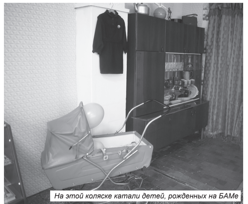
На этой коляске катали детей, рожденных на БАМе

января 2022 года! Это большой подарок к 50-летию БАМа, которое мы будем дружно отмечать в 2024 году, – подытожила Лариса Александровна.